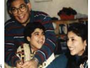
Alia avec son père et sa sœur

de famille ou des fêtes religieuses, les assistants veillaient toujours à ce qu'elle porte de beaux vêtements. Dans ses dernières années, alors que sa santé déclinait, ils ont été d'une attention généreuse et d'un soutien plein de sensibilité. Tout comme ma famille, ils ont été profondément peinés de la perdre et avec nous, ils chérissent aujourd'hui sa mémoire. Depuis, je rends visite dans la mesure de mes possibilités et j'aide en faisant partie d'un comité communautaire.